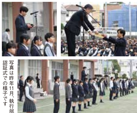
写真は昨年11月執行部 認証式での様子です