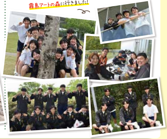
霧島アートの森に行きました!

第2学年 普通科・情報ビジネス科560名の生徒たちは霧島アートの森を訪問しました。2000年に開園し、国内外の現代美術家による美術作品の現代アート作品が23点展示されています。マスクを外している生徒も多くなり、笑顔や大きな声ごとびかい、最高の一日となりました。