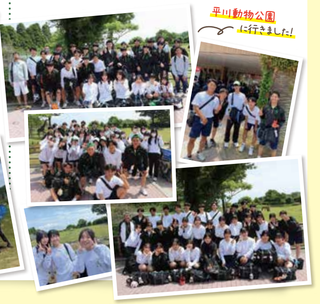
平川動物公園に行きました!

第3学年 普通科・情報ビジネス科412名の生徒たちは平川動物公園を各々散策しました。100頭以上の動物が飼育されている園内には、動物について学べるサイエンスセンターや、動物に触れることができるふれあい広場などもあり、動物について楽しく学ぶことができました。