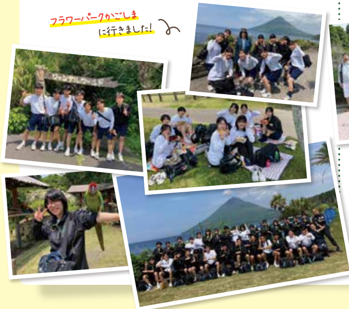
フラワーパークがこしまに行きました!

第3学年 英数科105名の生徒たちはフラワーパークがこしまを訪問しました。園内には、南アフリカやオーストラリアなどの亜熱帯植物や温帯植物を観察することができました。開聞岳を背景にした花広場や鹿児島(錦江)湾を一望できる展望回廊で記念撮影を楽しむ生徒も多かったようです。