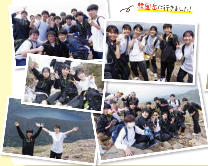
韓国岳に行きました!

第2学年 英数科97名の生徒たちは鹿児島県霧島市と宮崎県えびの市、小林市にまたがる霧島連山の最高峰である韓国岳に挑戦しました。素晴らしい天気のもと急こう配にも負けず、登山に挑戦した生徒が立派に登頂し、無事に下山することができました。韓国岳の山頂から見る、霧島連山の雄大な景色を眺めながらのお弁当は、最高の思い出になったようです。