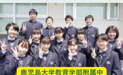
鹿児島大学教育学部附属中

勉強と部活動を両立でき、とても充実した生活が送れます。これから1人1人が輝ける鹿高で一生懸命頑張ります！